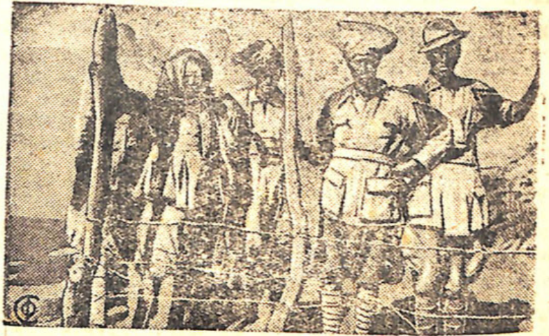
НА СНИМКЕ: Солдаты Итальянского туземного батальона, дезертировавшие с южного фронта итальянских войск в Абиссинии и ушедшие в британскую колонию Кения.