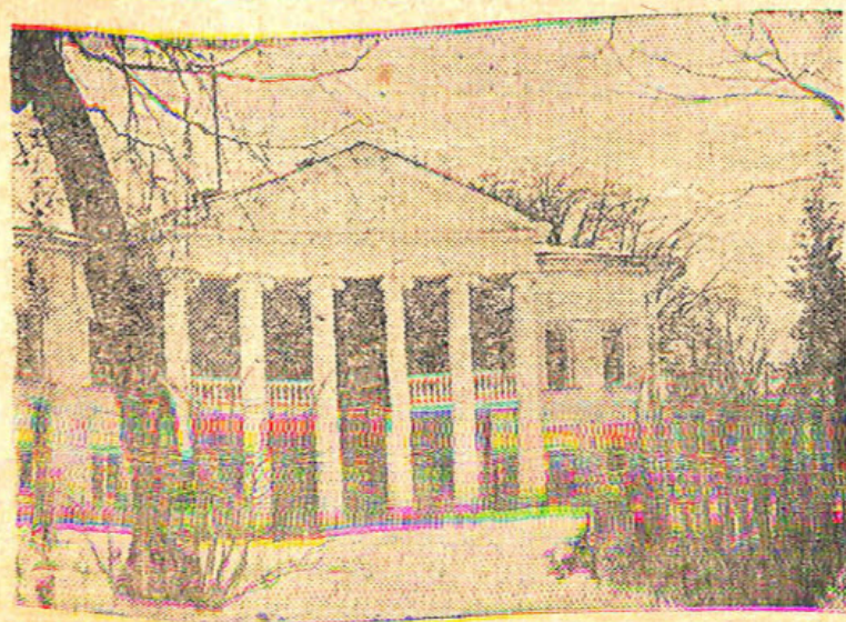
Дом в Горках, где умер В. И. ЛЕНИН.

Уходя от нас, т. Ленин завещал нам укреплять и расширять Союз республик. Клянемся тебе, т. Ленин, что мы выполним с честью и эту твою заповедь!