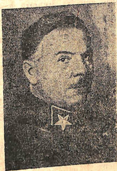
НА СНИМКЕ: Народный комиссар обороны, маршал Советского Союза — т. Ворошилов К. Е.

До 1 октября остается пять дней, срок очень короткий, за этот срок нужно устранить все недостатки с тем, чтобы с 1 октября обеспечить массовый выход в лес лесорубов, хороший прием их в лесу и начать организованно лесозаготовки.