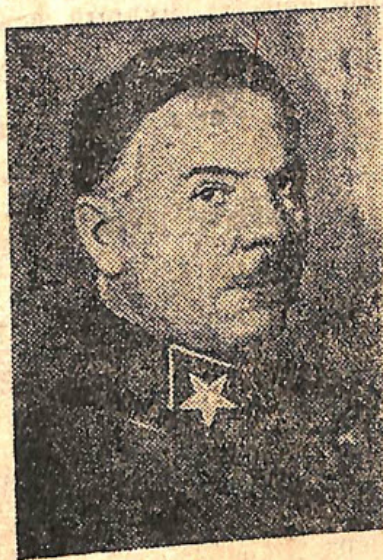
НА СНИМКЕ: Народный комиссар обороны, маршал Советского Союза — т. Ворошилов К. Е.

До 1 октября остается пять дней, срок очень короткий, за этот срок нужно устранить все недостатки с тем, чтобы с 1 октября обеспечить массовый выход в лес лесорубов, хороший прием их в лесу и начать организованно лесозаготовки.