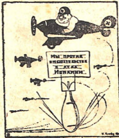
Фашистское „заверение“ с... приложением.

На бискайском (северном) фронте продолжается успешное наступление правительственных войск. За один день войска продвинулись на 10 километров и находятся в 13 километрах от Витории и в 40 километрах от Бургоса (местонахождение правительства мятежников). В рядах фашистской армии недовольство, участились случаи перехода солдат мятежной армии на сторону республиканских войск. 2 декабря на сто-