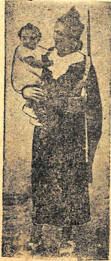
НА СНИМКЕ: Женщина-боец правительственных войск со своим ребенком.