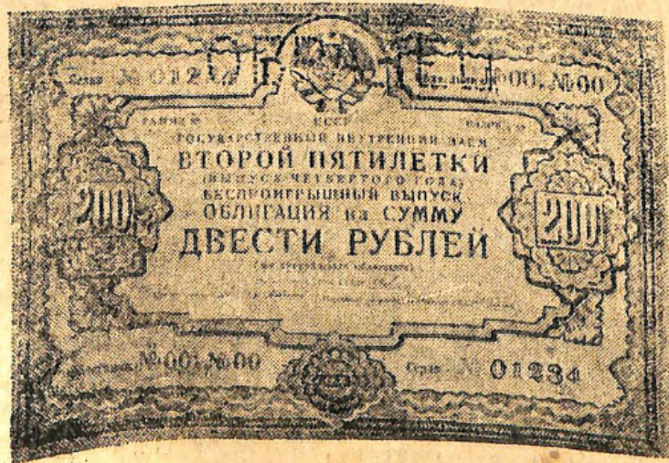
Образец облигации Займа Второй Пятилетки (выпуск четвертого года)

На 3 странице в пункте 12 не печатано: Подписчики неоплаченных ими облигаций Займа Второй Пятилетки (выпуск 4-го года). Следует читать (выпуск 4-го года).